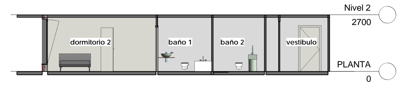
3 SECCION C 1 : 100